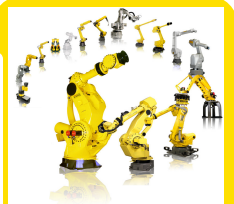
Mais de 200 modelos.