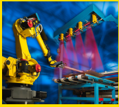
Sistemas de visão.