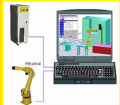
Robo Guide (Simulação).